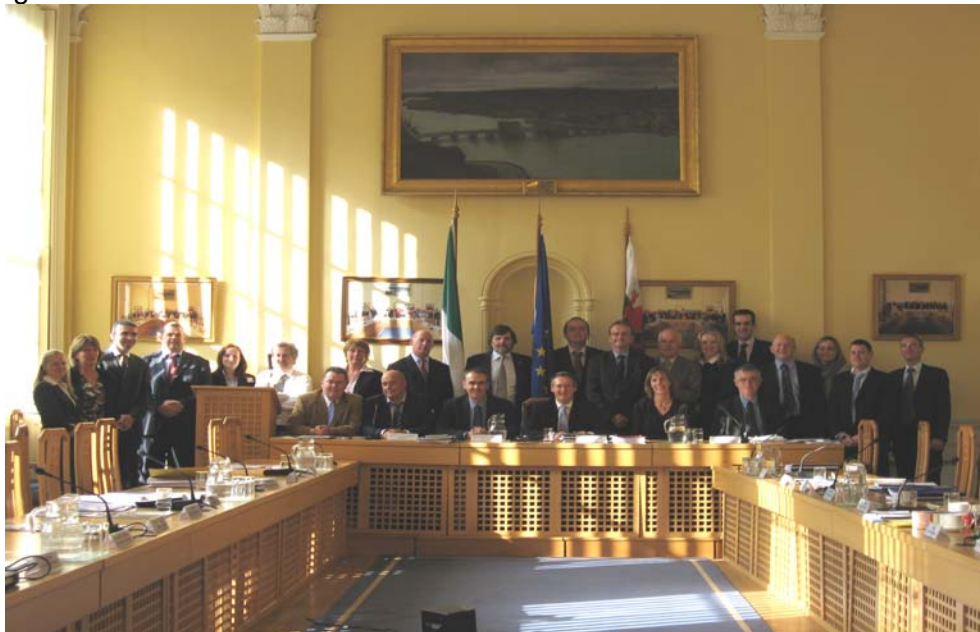
Baill de Choiste Monatóireachta an Chláir ag an gcéad chruinniú ar an 19ú Deireadh Fómhair 2007.

Críochnaíodh gach gníomhaíocht tionscadail nach raibh críochnaithe go fóill faoi Chlár Interreg IIIA na hÉireann-na Breataine Bige faoin 30ú Meitheamh 2008. Tá nósanna imeachta an chlabhsúir ar siúl ó shin. Tá sé i gceist an tuarascáil chlabhsúir a bhreathnú i Mí na Nollag 2009. Is é Rialtas Tionóil na Breataine Bige, Údarás Bainistíochta an Chláir, atá i gceannas ar an bpróiseas seo agus tugann an Tionól Réigiúnach tacaíocht dó tríd an Chomhrúnaíocht Theicniúil atá acu i láthair na huaire de réir mar a bhíonn gá léi.