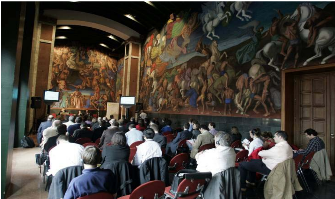
Rannpháirtithe ag Comhdháil Dheiridh ESTIIC

http://www.seregassembly.ie/interreg/interreg_3c/interreg_rfo_summary.asp?temp=&lang=en