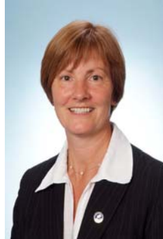
Breda White Oifigeach Cléireachais