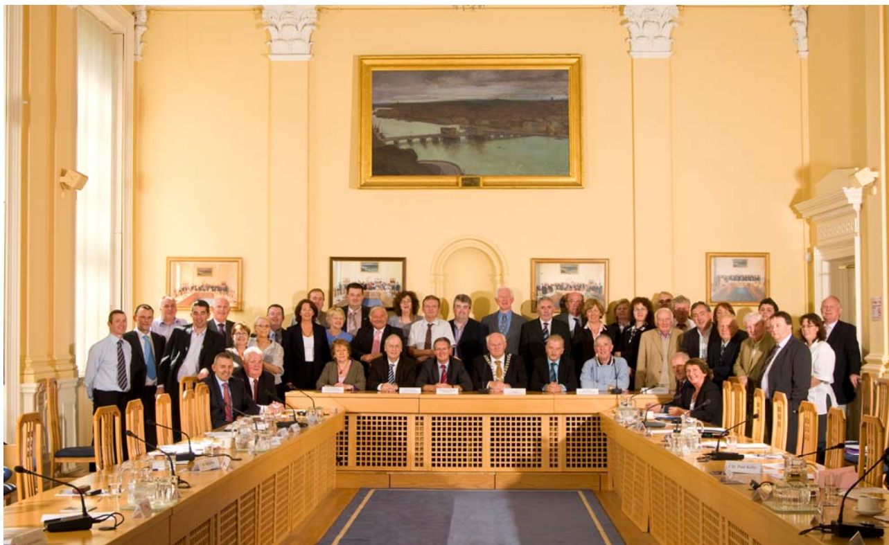
Comhaltaí agus Foireann an Tionóil Réigiúnaigh, Cruinniú Bliantúil ar an 11ú Iúil 2008