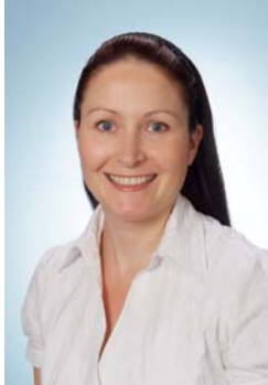
Eve Hayden Oifigeach Foirne Cúnta