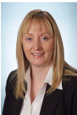
Edel Hunt Oifigeach Cléireachais